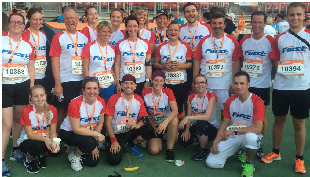
Unser Fürst-Team für den B2RUN Lauf, 21.07.2015

Danke an alle Mitarbeiterinnen und Mitarbeiter, die für unser Unternehmen gelaufen sind oder unsere Läufer so begeistert unterstützt haben. Es war ein tolles Ereignis und wir freuen uns schon auf nächstes Jahr.